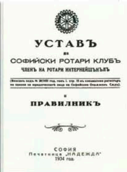
Учредителният протокол и Уставът на Ротари клуб - София