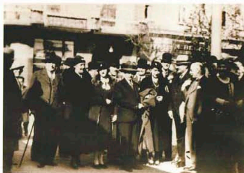
Ротарианци и гости пред "България" в деня на чартирането