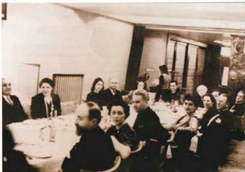
Среща по случай годишнината от основаването