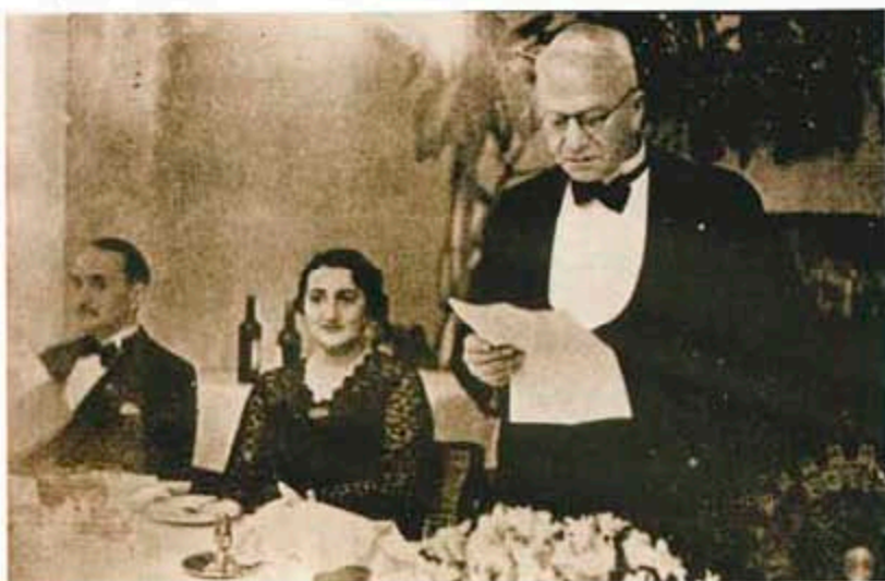
Среща с пълномощния министър на Франция Лабуре