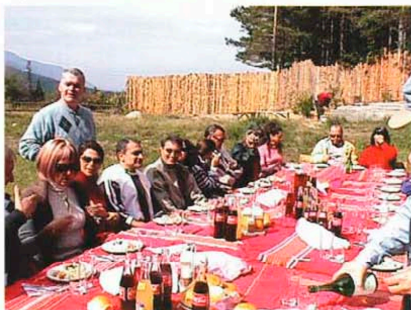
Най-добрата перспектива към Пирин