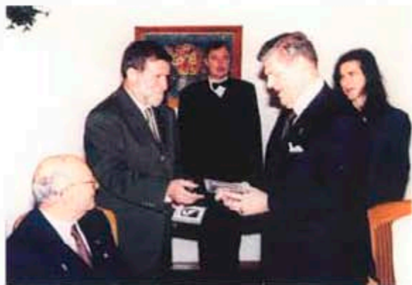
18-19 юни 1990 г. София, резиденция „Бояна“. Президентът на РИ Ричард Кинг получава от Стефан Драгостинов компактдиск с посветената на Ротари „Симфония за мира“.

Докато се стигна до 1990 година, до възобновяването на Ротари клуб в България, до концерта в НДК, до първото и засега единствено завръщане на Стефан Цонев в България след близо пет емигрантски десетилетия. На същия този голям българин принадлежи и идеята за разпространението на тази симфония сред Ротари клубовете по цял свят - като послание за мир и съзидателност.