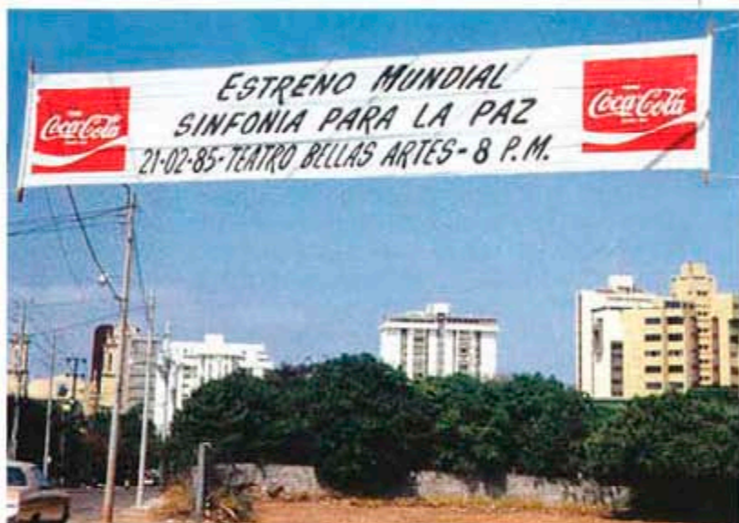
Венецуела, щат Зулия, Маракайбо, февруари '85. Улиците на града с плакати за предстоящото събитие

град - столица на щата Зулия: в различни периоди, различни президенти бяха обединявали усилията на различни специалисти и на гражданството, за да се изгради университет-